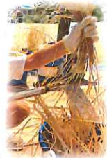
鎌を持って稲刈りに挑戦!!

🇯🇵 * 🇮🇹 * 🇺🇸 * 🇲🇾 * もうすぐ運動会!! 日々の活動で どんどん気合いが入っていく子どもたちです。初めはうまくいかず、悩んだりもした和太鼓演奏も、だんだん揃って始め、「自分だけでなく周りの音を聞く」という事ができるようになってきました。鉄棒や跳び箱も日に日に上達している中で、「早くお家の人たちに見てほしい」とロクにつぶやいています。運動会本番は、緊張は必す、失敗する事があるかもしれませんが、どうか、最後まで温かく見守って頂き、大きな拍手をお願いしたい!! そして、子どもたちが描いた万国国旗も見てあげて下さいね!!